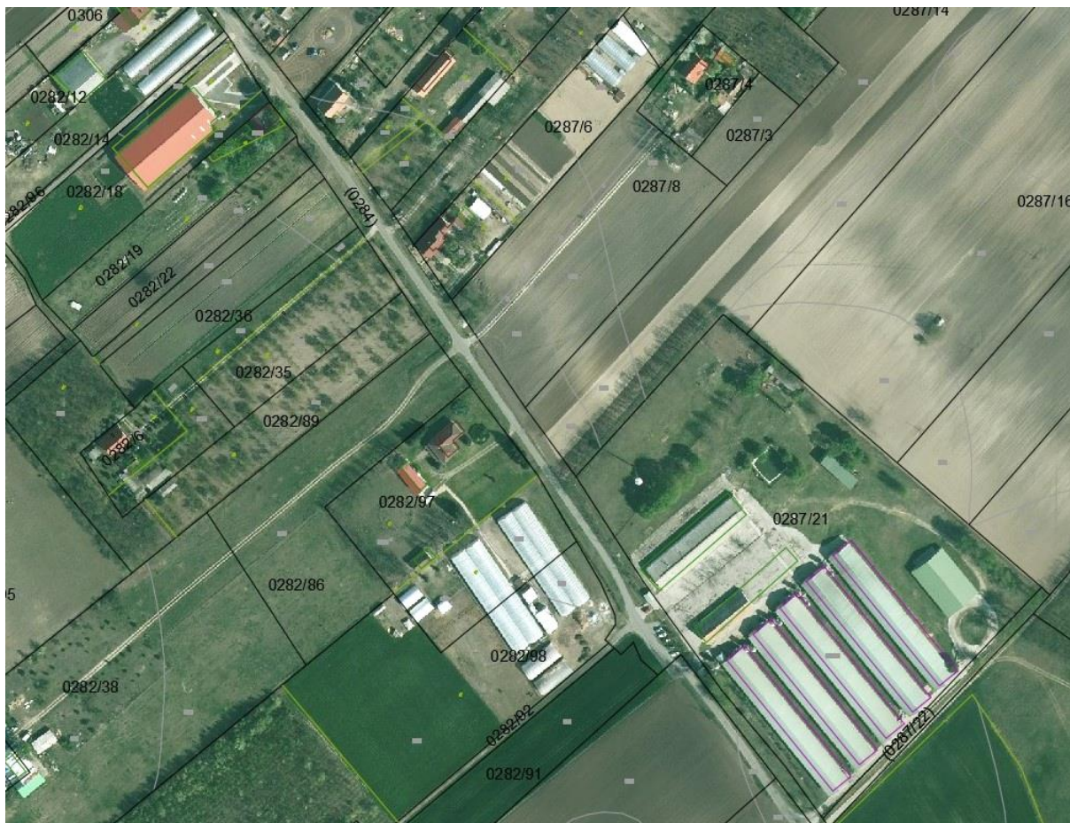
Ortofotó (E-TÉR) a Félégyházi vízfolyás középső szakaszáról a Polyák Borbirtoknál