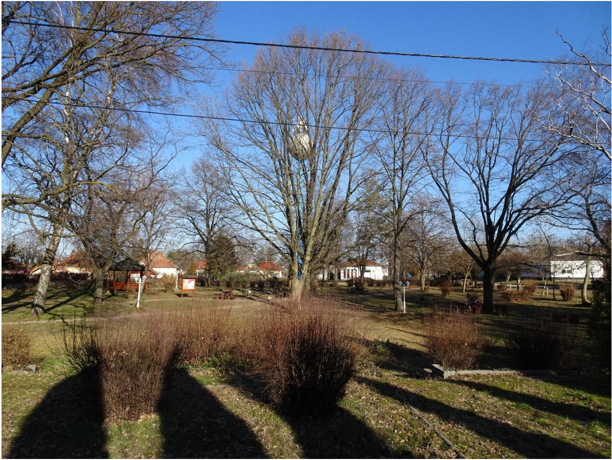
Sportpálya a községközponttól D-re