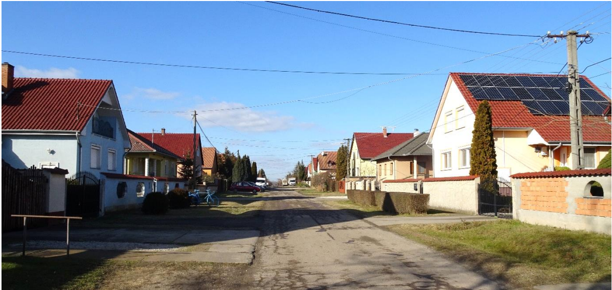
E századi beépítés a Lődomb utcában (belterület K-i osztás)