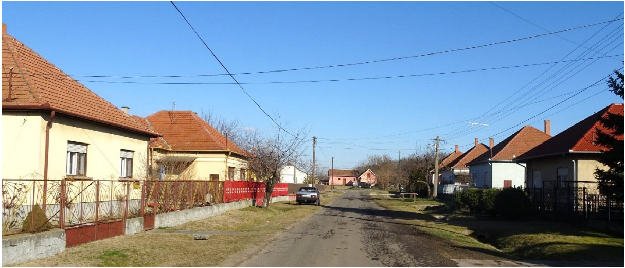
A '70-es és '80-as évek beépítése a Kölcsey utcában